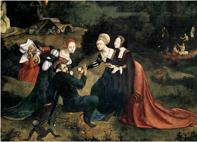
PATENIER, Joaquín Tentación de San Antonio c. 1515 Museo del Prado, Madrid