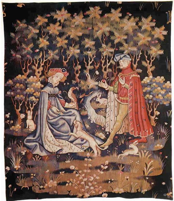
MAESTRO DESCONOCIDO, Flamenco La ofrenda del corazón c. 1410 Musée de Cluny, París

Como la naturaleza siente el hormigueo de las pasiones, hay que buscar la raíz del pecado para combatirla . Y la raíz se encuentra en el corazón; la pureza se vive en el cuerpo, pero se vive sobre todo en el alma .