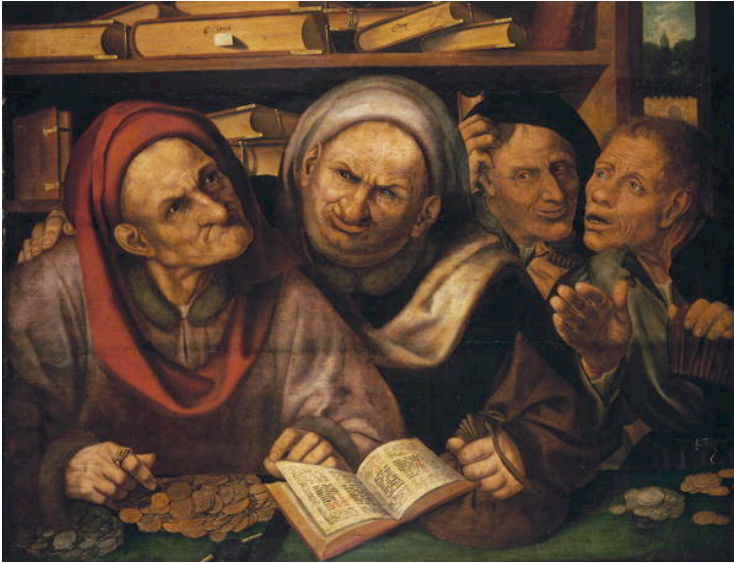
METSYS, Quentin Los prestamistas Galleria Doria Pamphilj, Roma