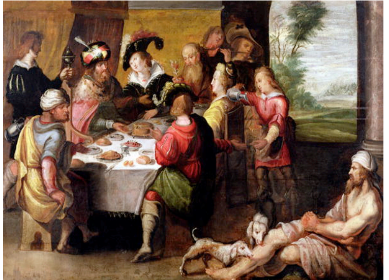
FRANCKEN, Frans II el Joven La parábola de Lázaro y el hombre rico Musée Municipal Cambrai Francia