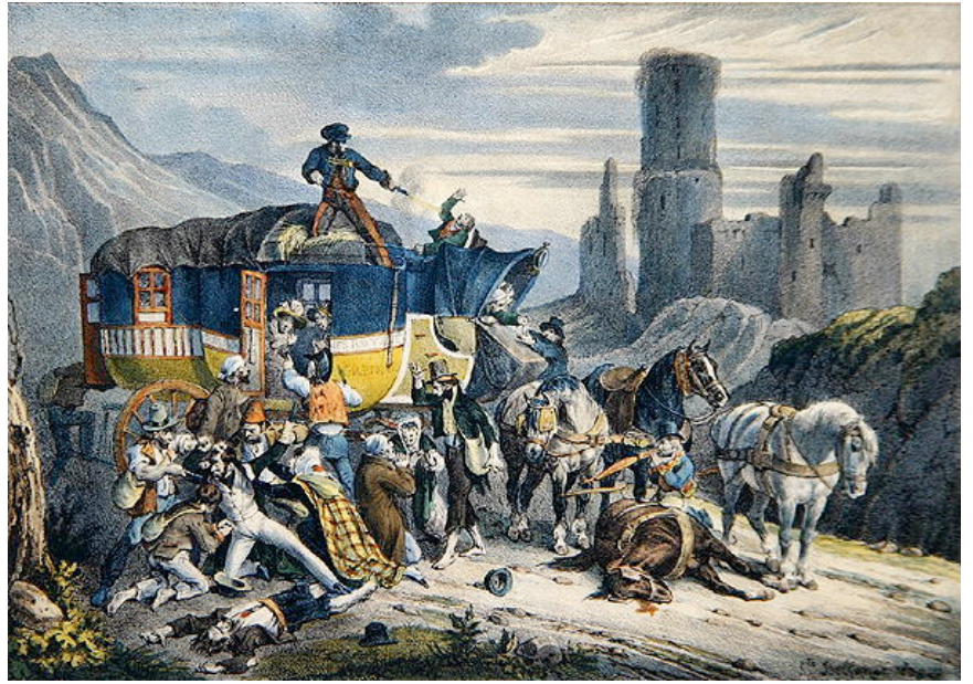
HIPPOLYTE BELLANGE, Joseph-Louis La bolsa o la vida 1827 Colección privada

Cuando se roba o estropea algo produciendo un daño importante en los bienes de los demás, se comete un pecado grave; el pecado es venial, si el daño es pequeño. El pecado grave se perdona en la confesión, si al arrepentimiento acompaña la intención (al menos) de devolver lo robado o reparar el daño; si no existe esta intención, el pecado no se perdona. Si ya no se tiene lo robado, hay que devolverlo de los bienes propios o comprar otra cosa igual a lo robado, y devolverlo. Si no se sabe qué hacer, preguntar al confesor.