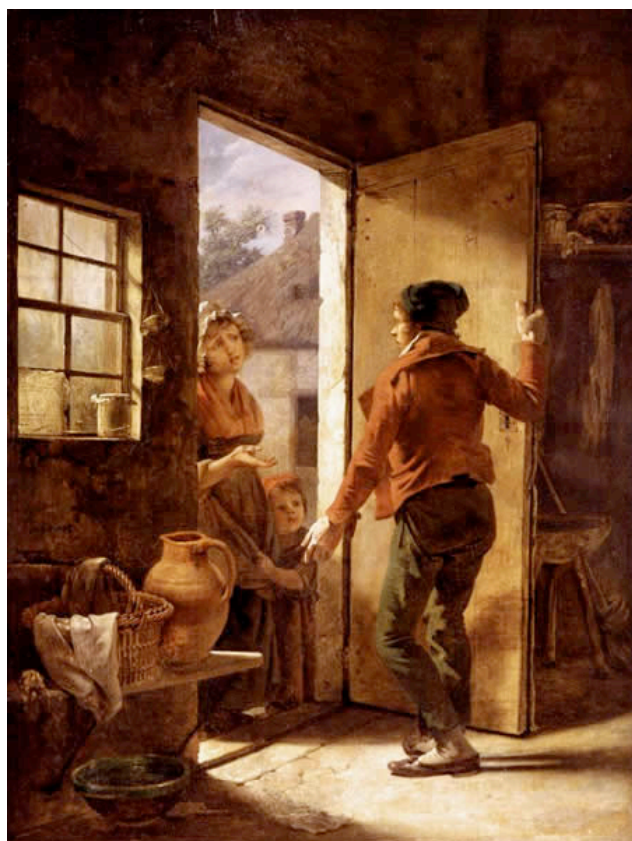
DROLLING, Martin Limosnas a los pobres Colección privada