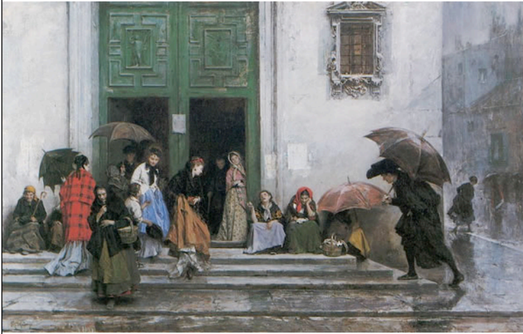
MADRAZO Y GARRETA, Raimundo de (1841-1920) Saliendo de la iglesia