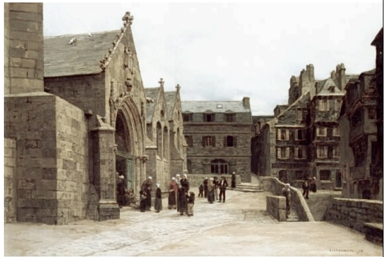
L'HERMITTE, Léon-Augustin (1844-1925) Salida de la iglesia de Saint-Melaine en Morlaix 1875

Para ayudarnos a cumplir el tercer mandamiento de la ley de Dios, la Iglesia ha impuesto la obligación de oír Misa entera todos los domingos y fiestas de guardar. Este mandamiento obliga al cristiano que ha cumplido 7 años y tiene uso de razón. El que no asiste a Misa comete pecado mortal, a no ser que esté dispensado, como es el caso de un enfermo o el que cuida del enfermo, o si tiene que recorrer una distancia larga, etc.; es decir, siempre que haya una causa justa y grave . Si se tiene duda, debemos preguntar.