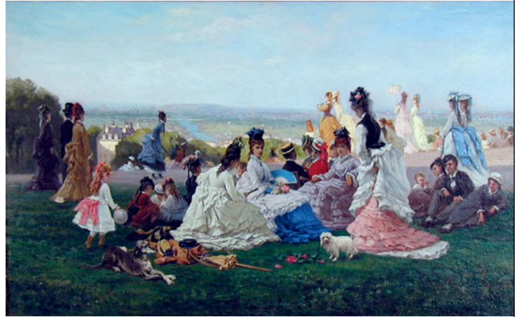
FOULHAUSE, August Tarde del domingo

En el libro del Éxodo se leen estas palabras que Dios dijo a Moisés y a su pueblo: "Seis días trabajarás y harás todas tus obras, pero el día séptimo es día de descanso para el Señor, tu Dios. Ningún trabajo servil harás en él, ni tú, ni tu hijo, ni tu hija, ni tu criado, ni tu criada, ni tus bestias de carga, ni el extranjero que habita dentro de tus puertas. Pues en seis días hizo el Señor el cielo y la tierra, el mar y todo cuanto contienen y el séptimo descansó" (Éxodo 20,9-11).