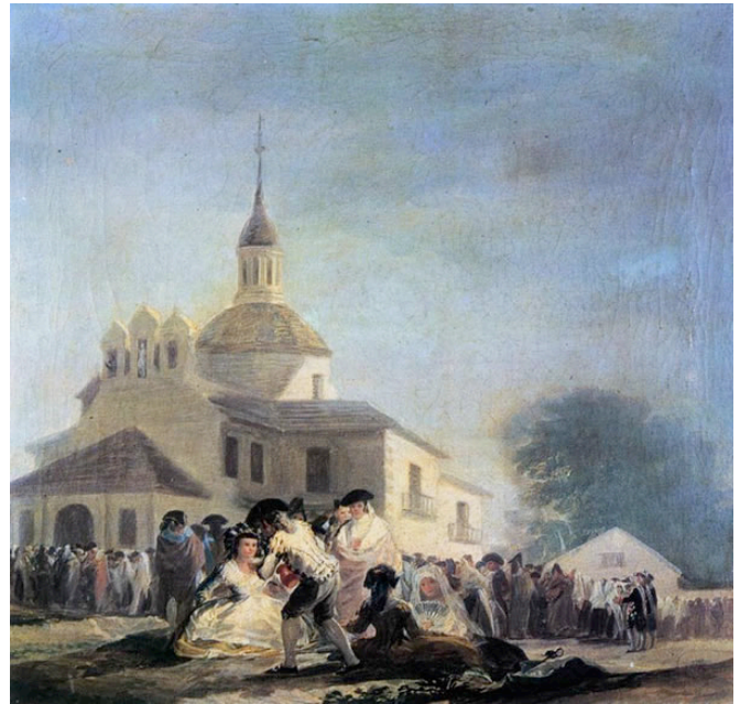
GOYA, Francisco de (1746-1828) Peregrinación a la iglesia de San Isidro 1788 Museo del Prado, Madrid

La vida humana sigue un ritmo de trabajo y descanso. La institución del domingo contribuye a que todos disfruten del tiempo de descanso y solaz suficiente, que les permita cultivar su vida familiar, cultural, social y religiosa.