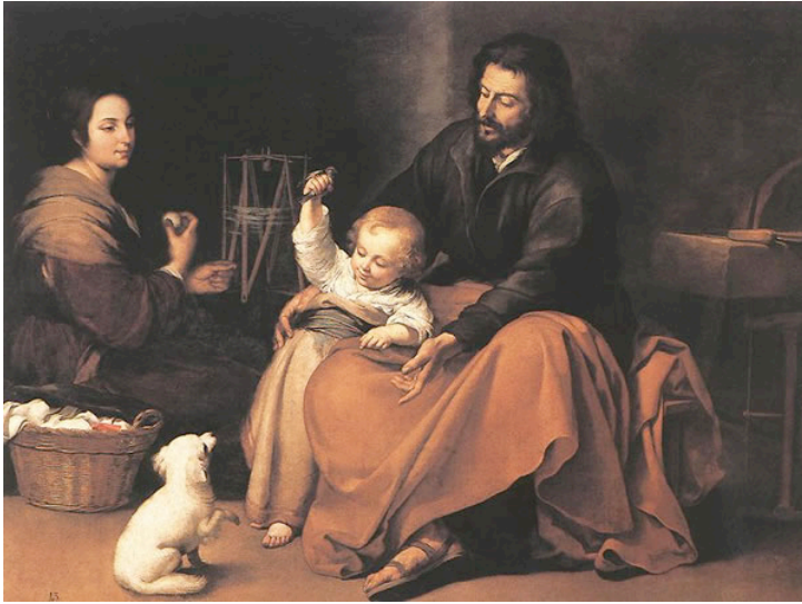
MURILLO, Bartolomé Esteban La Sagrada Familia del pajarito 1650 Museo del Prado, Madrid