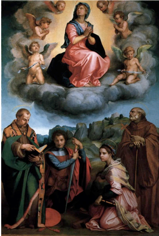
ANDREA DEL SARTO Virgen con cuatro santos 1530 Galleria Palatina (Palazzo Pitti), Florencia