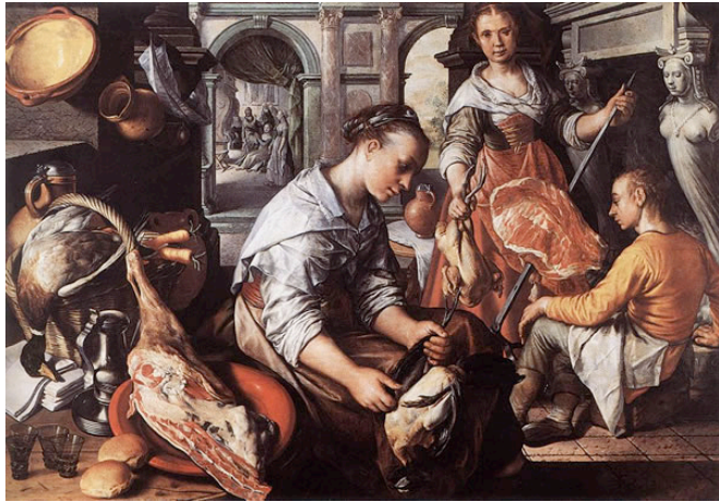
BEUCKELAER, Joachim Cristo en casa de Marta y María 1565 Musées Royaux des Beaux-Arts, Bruselas

■ Toda la vida de Jesús fue una continua enseñanza: