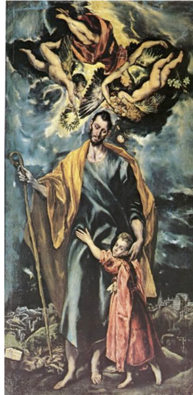
GRECO, El San José y Jesús Niño 1597-99 Capilla de San José, Toledo

Sabemos que Jesús nació de la Virgen María, concebido por obra y gracia de Espíritu Santo. Dios era su Padre, pero quiso que alguien hiciera las veces de padre en la tierra. La persona elegida fue José, un varón justo de la casa de David. José, esposo virginal de María y padre legal de Jesús, ejerció con Ella y con el Hijo de Dios los oficios de esposo y de padre en la tierra. Con su trabajo de artesano en el pequeño pueblo de Nazaret procuró el alimento, cuidó a la Virgen y a Jesús, y enseñó a éste su oficio.