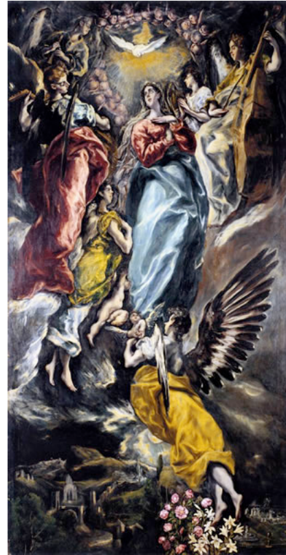
GRECO, El La Virgen de la Inmaculada Concepción 1608-13 Museo de Santa Cruz, Toledo

El don más grande que Dios concedió a María Santísima es el de ser su Madre . Y, por ser su madre, la llenó de gracia y de extraordinarios privilegios. Queremos conocer muy bien a la Virgen, y por eso conviene saber lo que Dios ha hecho en Ella: