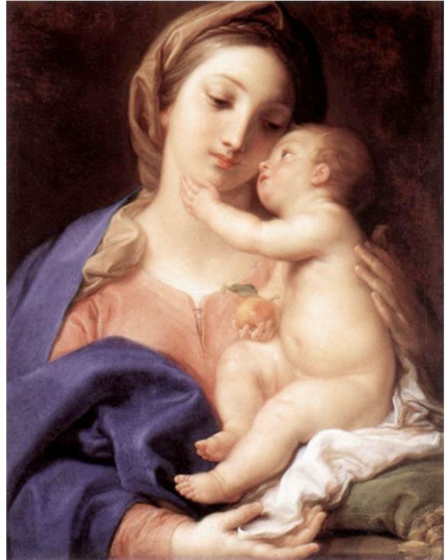
BATONI, Pompeo La Virgen y el Niño c. 1742 Galleria Borghese, Roma

Los grandes acontecimientos o misterios de la infancia de Jesús son: