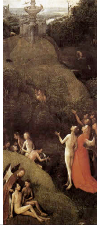
BOSCH, Hieronymus El Paraíso Terrenal Palazzo Ducale, Venecia

Dios creó a Adán y Eva, los llenó de dones sobrenaturales y preternaturales y los puso en el paraíso terrenal. Allí eran muy felices: eran sus amigos y no sufrían mal alguno; trabajaban, pero sin cansarse... Después de ser felices en la tierra, hubieran pasado -sin morir- a gozar de Dios para siempre en el cielo.