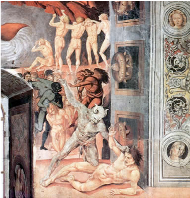
SIGNORELLI, Luca Los condenados enviados al infierno (detalle) 1499-1502 Chapel of San Brizio, Duomo, Orvieto