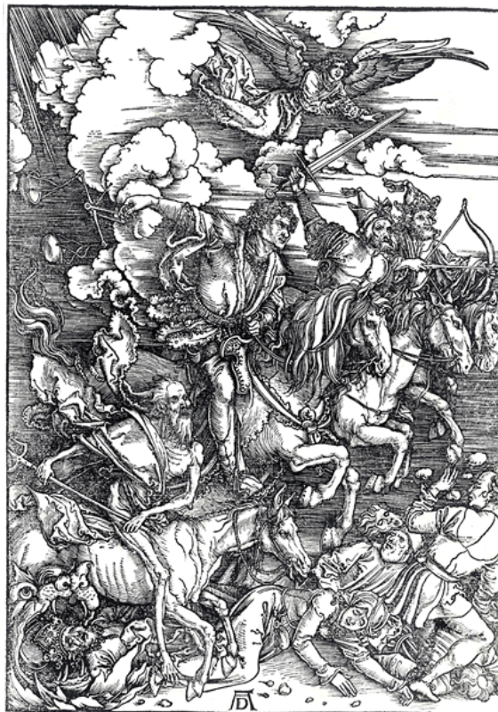
DURERO Los cuatro jinetes del Apocalipsis (1498)

Al ser Adán principio y cabeza del género humano, perdió él la gracia y los dones que la acompañaban, y los perdieron sus descendientes: en Adán pecó todo el género humano. Es decir, al recibir de nuestros primeros padres la naturaleza, la recibimos manchada con aquella culpa y, por tanto, privados de la gracia y de todos los demás dones; y por perderse la armonía interior, quedamos inclinados al pecado ( concupiscencia ). Esto es lo que se llama pecado original , con el que todos nacemos.