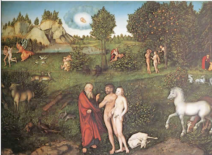
CRANACH, Lucas the Elder El Paraíso 1530 Kunsthistorisches Museum, Viena