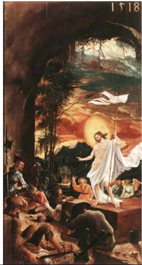
ALTDORFER, Albrecht La resurrección de Cristo c. 1516 Kunsthistorisches Museum, Viena