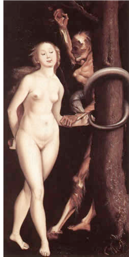
BALDUNG GRIEN, Hans Eva, la serpiente y la muerte 1510-12 National Gallery of Canada, Ottawa

Igual que a los ángeles, Dios quiso someter a nuestros primeros padres a una prueba y les puso un mandamiento para probar su fidelidad. Si lo cumplían, conservarían para sí y sus descendientes las gracias y dones que Dios les dio; si no lo cumplían, perderían las gracias y dones para sí y para sus descendientes. Dios, que podía imponer este mandato porque es Dueño y Señor absoluto del hombre, quería que vencieran.