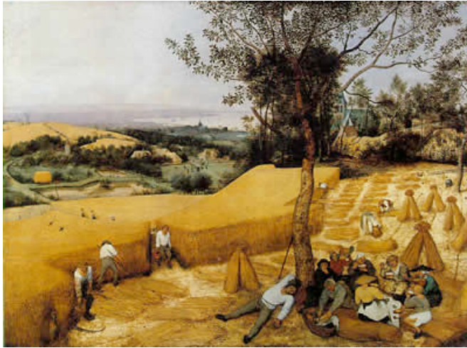
BRUEGEL, Pieter the Elder La cosecha de maíz 1565 Metropolitan Museum of Art, New York