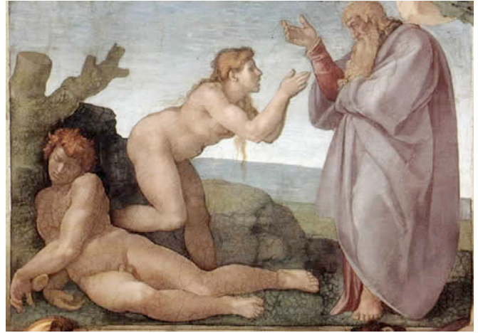
MICHELANGELO Buonarroti Creación de Eva 1509-10 Cappella Sistina, Vaticano

Cuando contemplamos una obra de arte -una catedral, por ejemplo-, nos maravillamos y alabamos el genio de sus autores. Aquella obra de arte es una gloria para los que la construyeron.