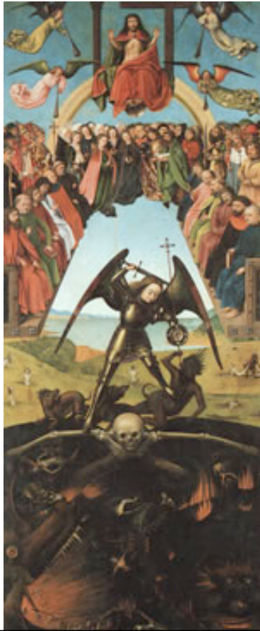
CHRISTUS, Petrus El Juicio Final 1452 Staatliche Museen, Berlin