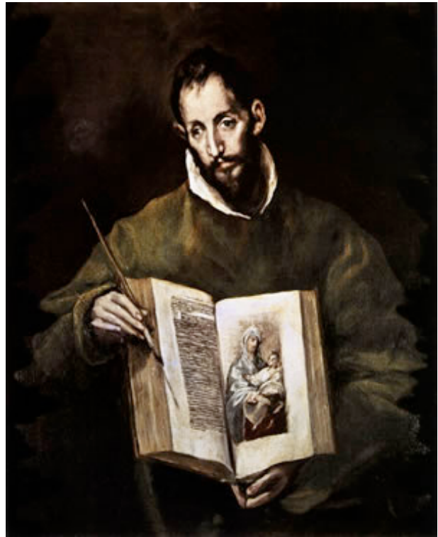
GRECO, El San Lucas 1605-10 Catedral, Toledo