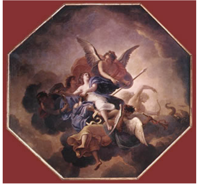
LE BRUN, Charles El triunfo de la fe 1658-60 Château, Vaux-le-Vicomte

Al leer el Evangelio se ve que Jesucristo pide un acto de fe antes de realizar el milagro; y se alegra, y alaba a las personas que -de un modo u otro- manifiestan su fe. La fe es un gran don de Dios, necesario para nuestra salvación; y la respuesta del hombre a la Revelación divina es creer lo que nos ha dicho, apoyados en su autoridad divina.