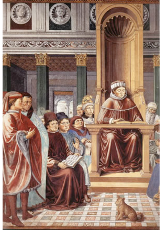
GOZZOLI, Benozzo San Agustín enseñando en Roma (detalle) 1464-65 Capilla del ábside, Sant'Agostino, San Gimignano

Para acercarnos a Dios es preciso que aceptemos por la fe su Doctrina, su Enseñanza, contenida en la Tradición y en la Sagrada Escritura (la Biblia). Debe ser una aceptación no sólo teórica, sino también práctica, que tiende a que la fe reine, tenga implicaciones, consecuencias concretas en la vida, para seguirla fielmente en la propia conducta, en la propia forma de vivir.