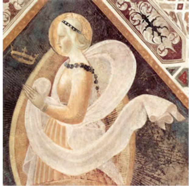
UCCELLO, Paolo Fe c. 1435 Duomo, Prato