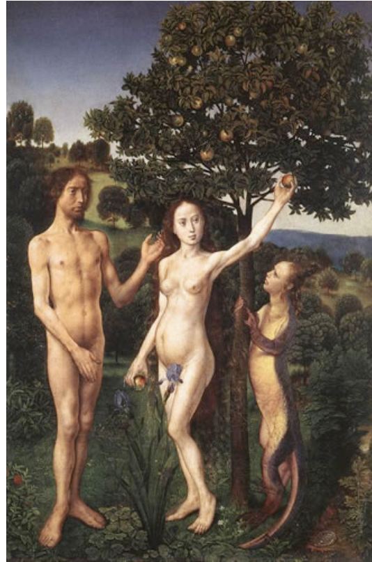
GOES, Hugo van der La caída 1467-68 Kunsthistorisches Museum, Viena

Pero a veces el hombre puede olvidarse de Dios e incluso rechazarlo o negar su existencia. ¿Motivos? La ignorancia, el rebelarse contra el mal que se sufre o se ve, los afanes del mundo y de las riquezas, el mal ejemplo de algunos que se llaman cristianos, ideas contrarias a la religión, y la actitud del pecador que -por miedo- se oculta de Dios y huye ante su llamada. Ninguno de estos pretextos justifica el olvido o la negación de Dios.