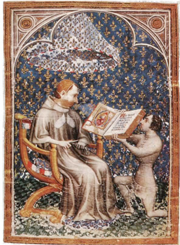
Miniaturista francés Biblia de Carlos V 1372 Rijksmuseum, La Haya