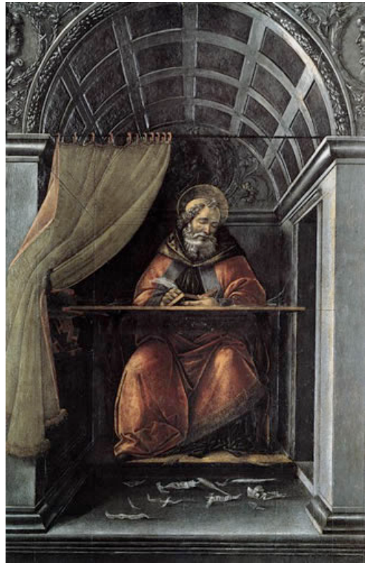
BOTTICELLI, Sandro San Agustín en su celda 1490-94 Galleria degli Uffizi, Florencia

San Agustín es uno de los santos más notables que ha tenido la Iglesia y uno de los hombres más sabios del cristianismo. Después de una vida apartada de Dios, se bautizó y llegó a ser obispo de Hipona, en el norte de África. Escribió mucho y tiene un libro especialmente sugerente: Las Confesiones , donde cuenta su conversión y proclama el anhelo de Dios inscrito en el corazón de la criatura: