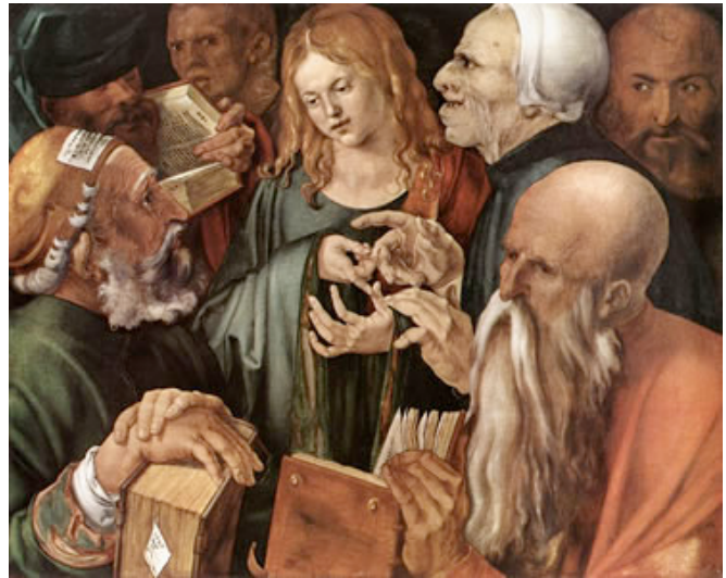
DÜRER, Albrecht Cristo entre los doctores 1506 Colección Thyssen-Bornemisza, Madrid