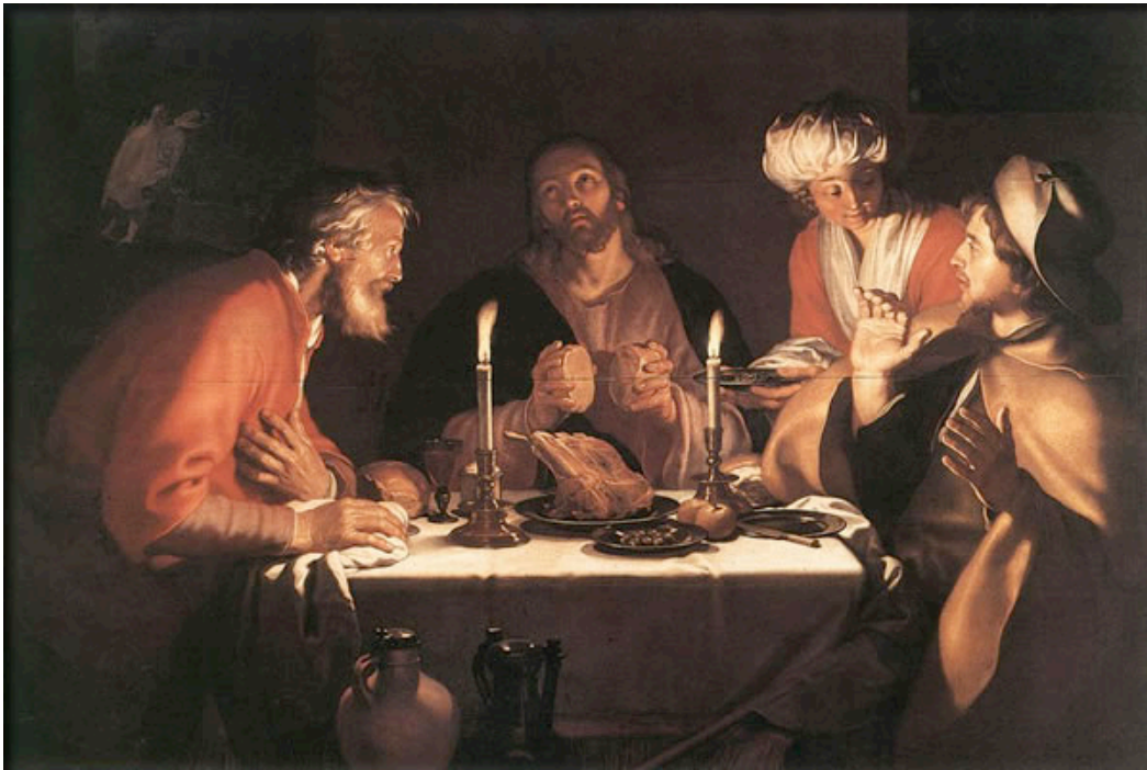
BLOEMAERT, Abraham Los discípulos de Emaús 1622 Musées Royaux des Beaux-Arts, Bruselas