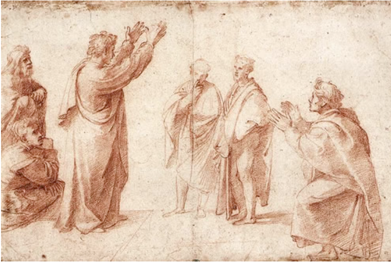
RAFFAELLO Sanzio Estudio de San Pablo predicando en Atenas 1514-15 Galleria degli Uffizi, Florencia