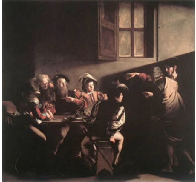
CARAVAGGIO La vocación de Santo Tomás 1599-1600 Contarelli Chapel, San Luigi dei Francesi, Roma

Dios además, por amor, se ha revelado al hombre, saliendo a su encuentro; de esta forma, le ofrece una respuesta definitiva a las preguntas que se hace sobre el sentido y el fin de la vida humana [se pueden recordar las preguntas que nos hacíamos en la primera catequesis: de donde venimos, quiénes somos, a dónde vamos...]. Se dio a conocer, en primer lugar, a los primeros padres, Adán y Eva; después de la caída por el pecado original, no los abandonó sino que les prometió la salvación y ofreció su alianza. Luego, con Abrahán, eligió al pueblo de Israel. Por fin, Dios se reveló plenamente enviando a su propio Hijo, Jesucristo.