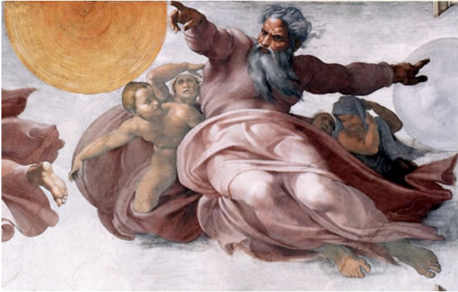
MICHELANGELO Buonarroti Creación del sol, la luna y las plantas (detalle) 1511 Cappella Sistina, Vaticano